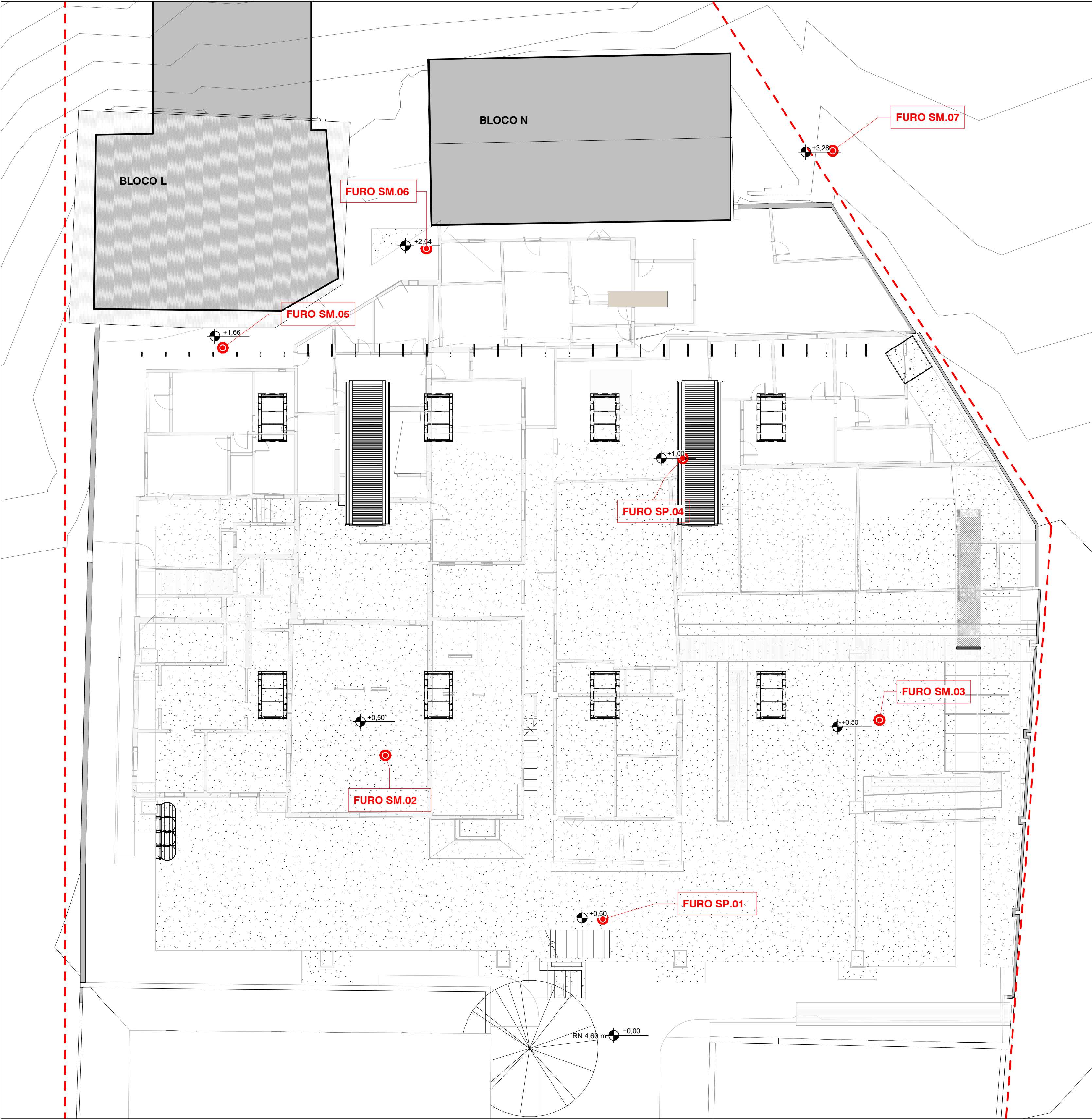
1 LOCAÇÃO FUROS SONDAGEM ESCALA: 1 : 125